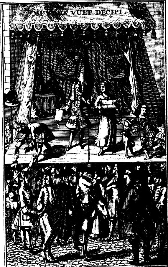
La Charlatanerie des Savans.